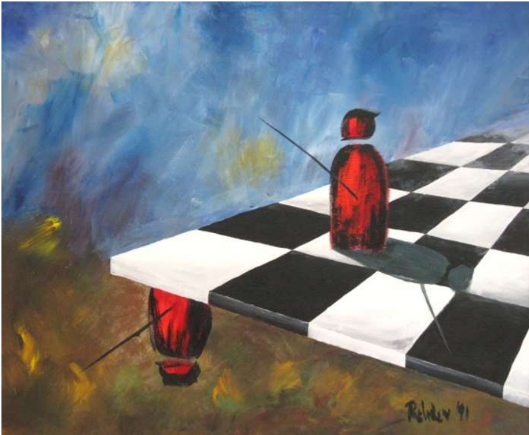
Ölbild: Elke Rehder